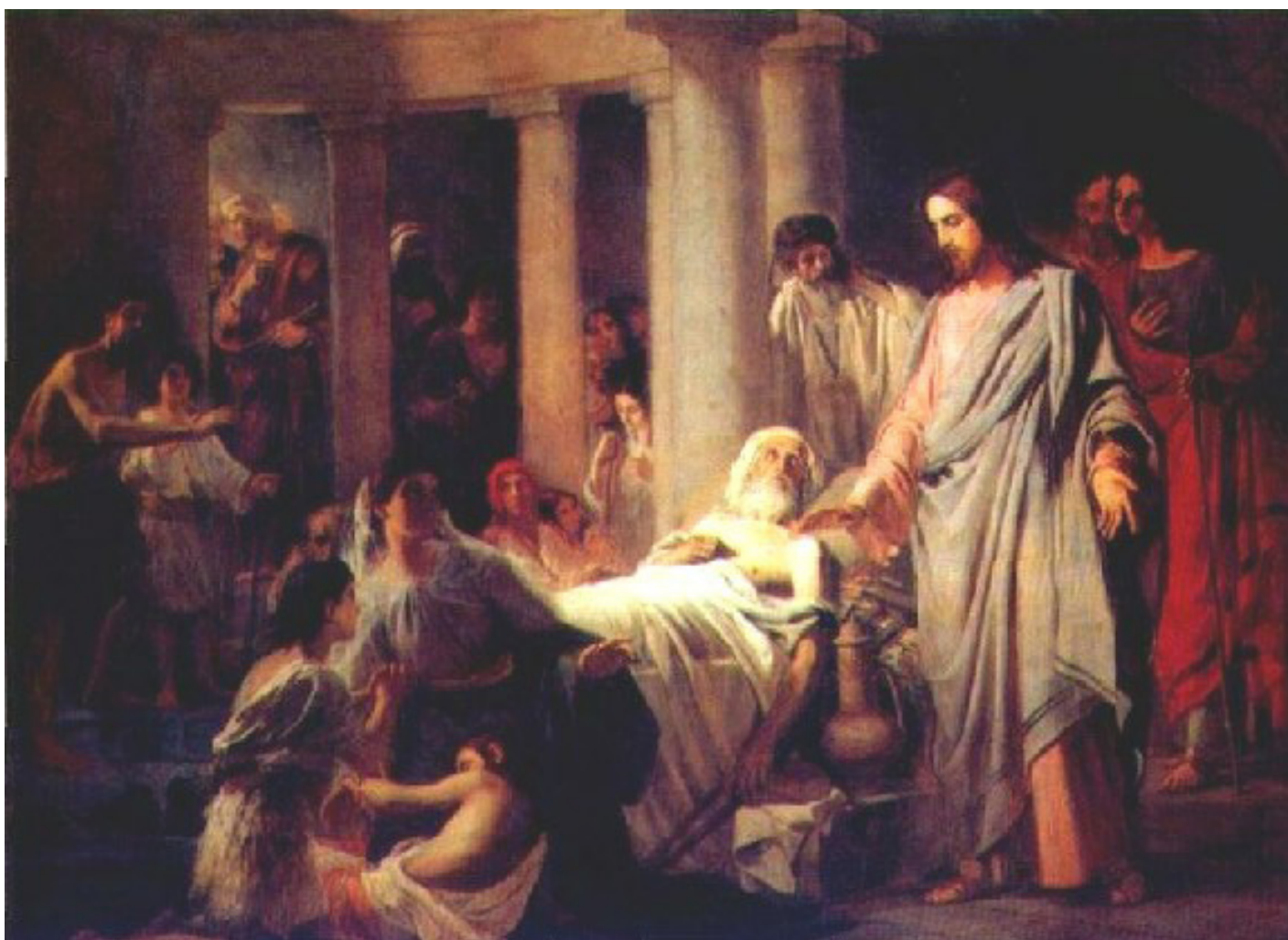
Исцеление расслабленного у Овечьей купели. Художник: Ф. Бруни

наш Искупитель получил невольного помощника в Своём подвиге. А ведь Симон был обычным человеком: отец двух сыновей – Руфа и Александра – неместный, и он ►