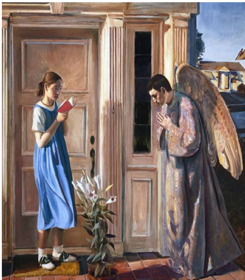
Художник Джон Коллер. Благовещение

В этот праздник мы поражаемся вежливости и смирению Бога, просящего человека о сотрудничестве. Мы поражаемся