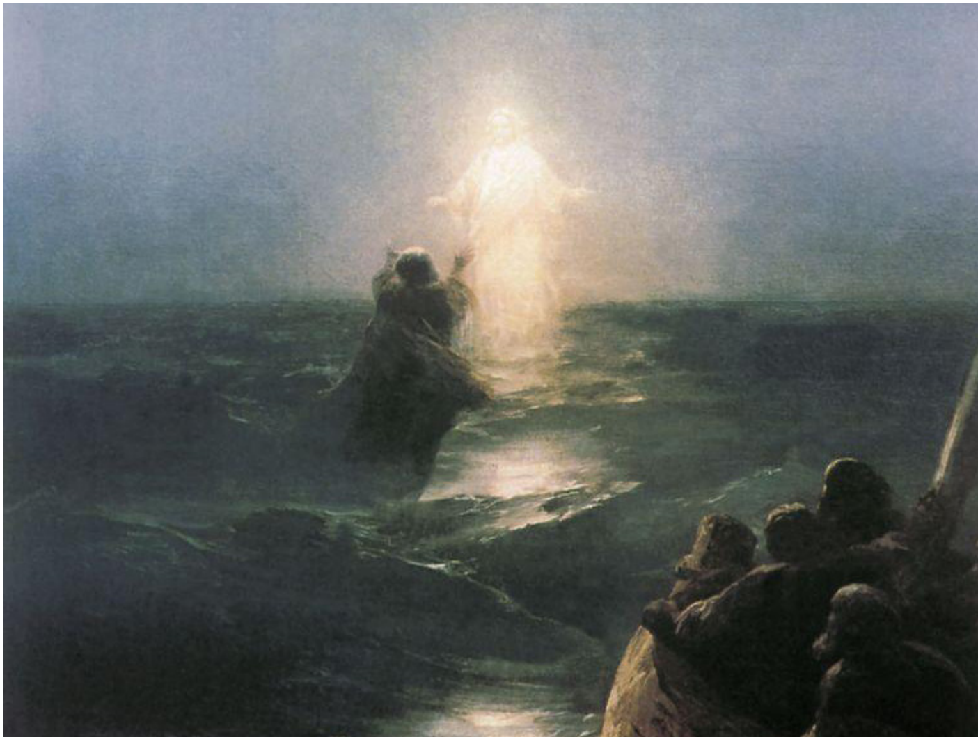
«Хожжение по водам», И.К. Айвазовский, фрагмент