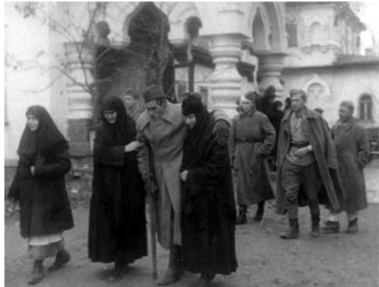
В Великую Отечественную войну

Какое же было мое изумление, и радость, когда совсем недавно на второй день Пасхи был я в гостях у одного из на-