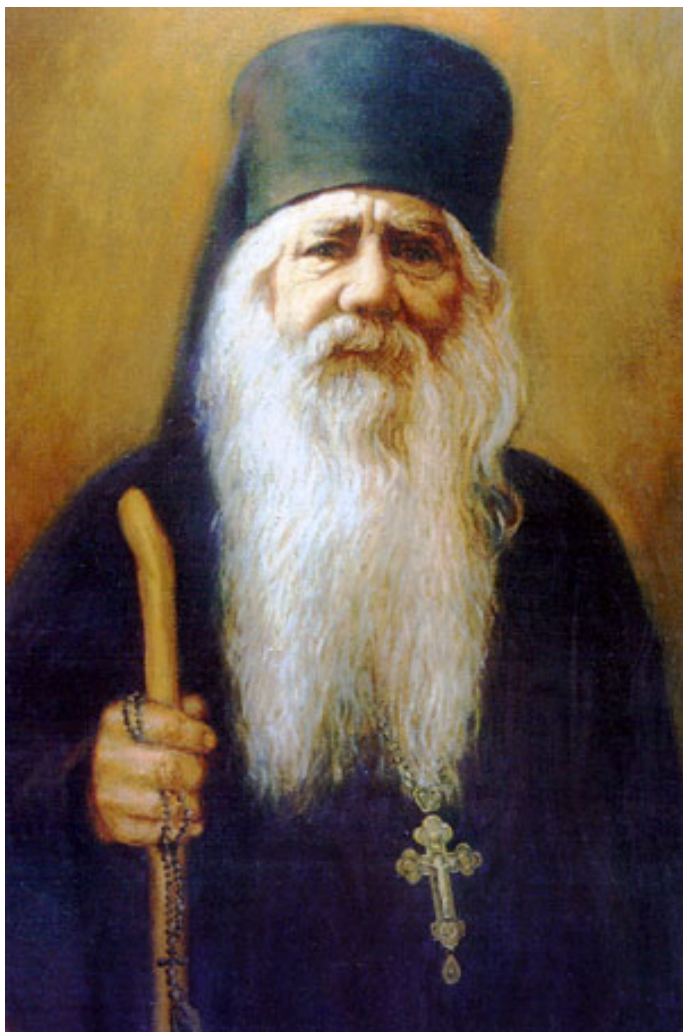
Архимандрит Павел (Груздев)

Сейчас идет пост. Пост - телу чистота, душе красота! Пост - ангелов радование, бесов горе. Но надо помнить: в наше время лучше совсем не поститься, чем поститься без ума. Сказано: будьте мудры, яко змия.