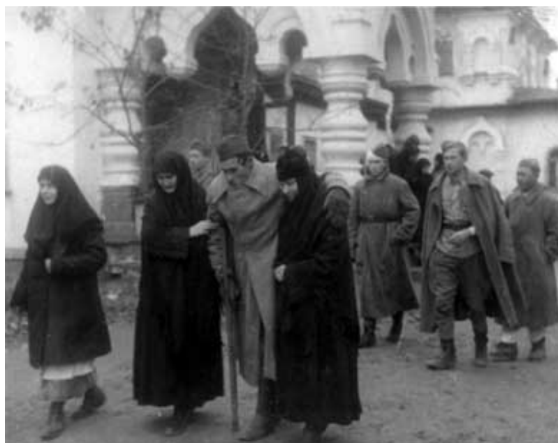
В Великую Отечественную войну

в гостях у одного из наших пожилых священников, который отслужил в храме Божьем уже несколько десятилетий и прошел с Церковью все нелегкие годы ее советской истории. При мне расколол батюшка прошлогоднее яйцо, и оно было как свежее, не затухло, и не было никакого запаха. С точки зрения ученых, неверующих людей и прочих сомневающихся — это непонятно, противоестественно. Для верующего же